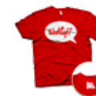
↳ red nieuw ook in 3XL