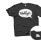
↳ dark grey nieuw