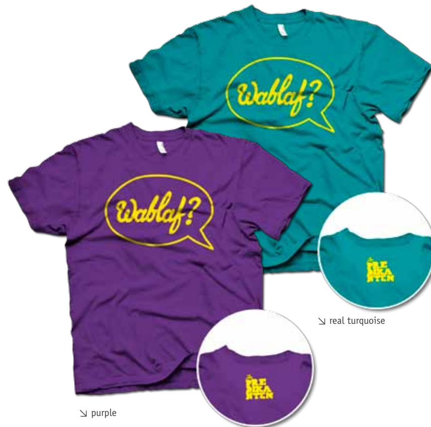
↳ real turquoise