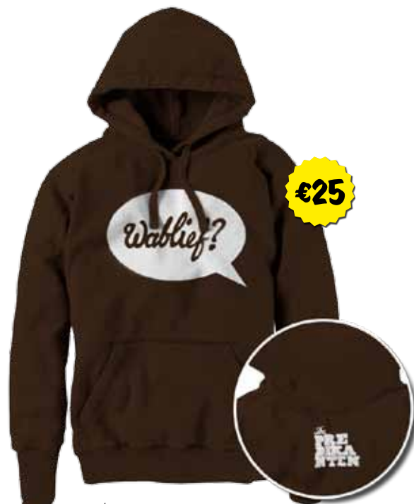
↳ brown nieuw

http://www.depredikanten.be/winkel/wablief-catalogoog.pdf pagina 2 van 2